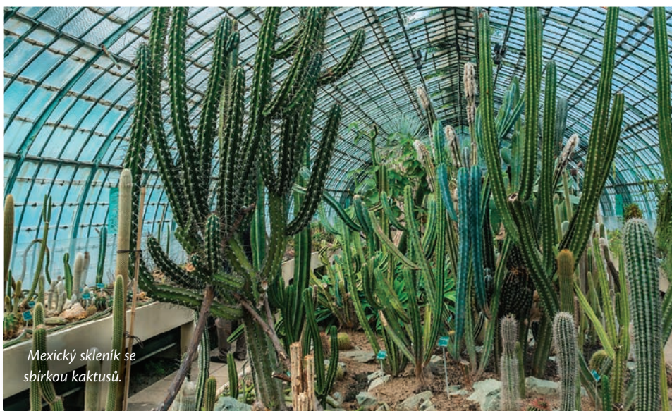
Mexický skleník se sbírkou kaktusů.

stromem. Je jím cedr libanonský ( Cedrus libani ), se kterým se pojí dokonce i legenda. Ta praví, že slavný cedr, který má v tuto chvíli téměř 13 metrů v obvodu, přicestoval v roce 1734 jako semenáč v klobouku přírodovědce Bernarda de Jussieu pocházejícího z významné francouzské rodiny botaniků.