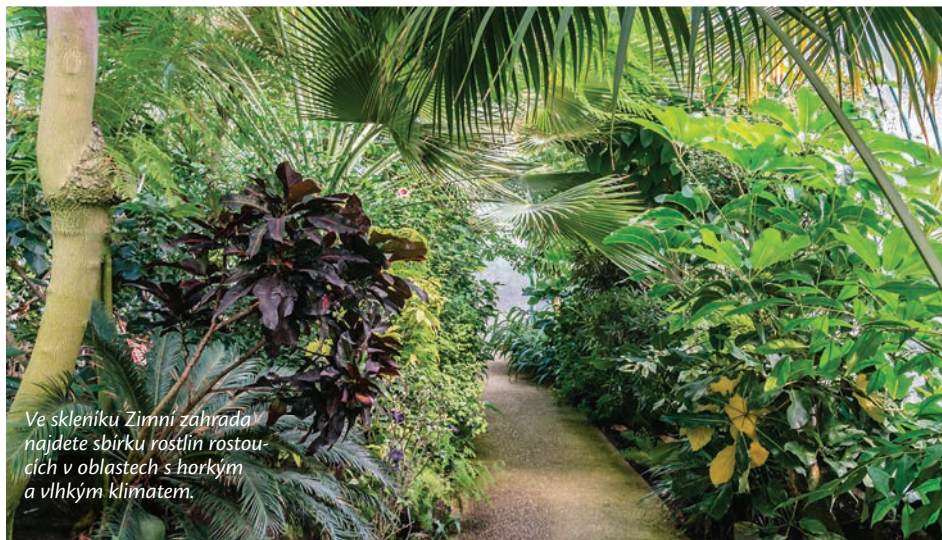
Ve skleníku Zimní zahrada najdete sbírku rostlin rostoucích v oblastech s horkým a vlhkým klimatem.